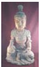
Bouddha en bois peint XA.0503.16