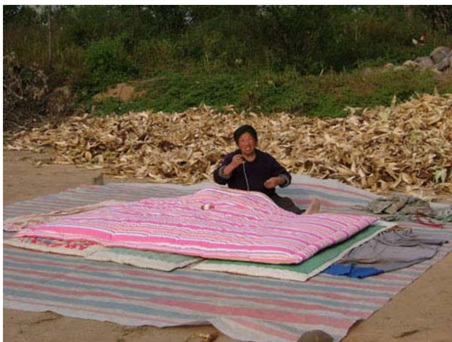
Fabrication maison d'une couette - Erliban