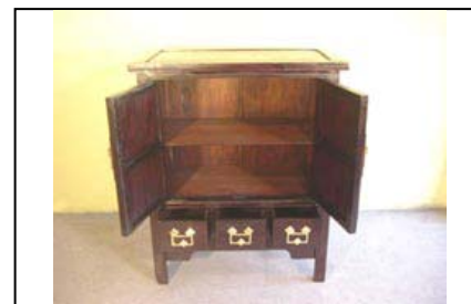
AR.0501.10 - Modifiée