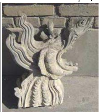
Élément de toiture en forme de dragon (Divinité protectrice)

Voici un aperçu de ce que nous vous proposerons bientôt sur le site :