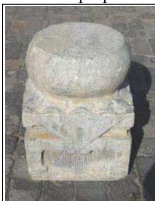
Support de pilier d'entrée Pierre sculptée