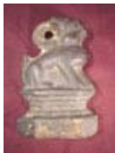
Poids en fonte en forme de lion HM.0503.07