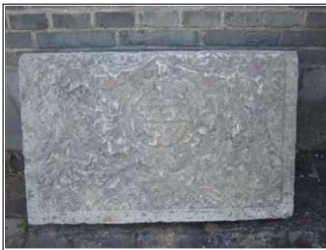
Pierre sculptée d'entrée de maison

D'ici à la publication sur le site (sans doute le mois prochain) de la totalité de ce nouveau catalogue avec toutes les photos, les détails et les dimensions, vous pouvez nous demander des clichés en grand format et tous les renseignements que vous voudrez concernant ces pièces.