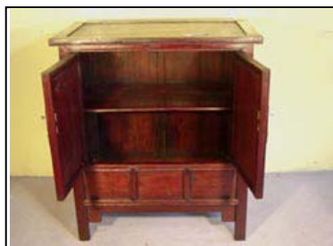
AR.0404.08 – Non modifiée