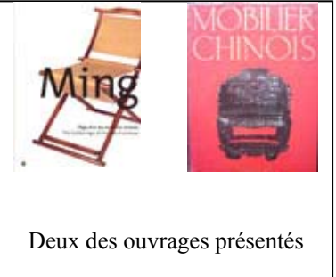
Deux des ouvrages présentés

Pour découvrir cette page : Cliquez sur ce lien