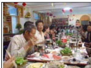
2- Le réconfort, au restaurant