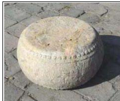
Support de pilier d'entrée Pierre sculptée