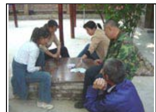
3 – La détente, à la maison