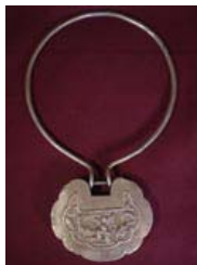
Cadenas de sortilège pour enfants PA.0504.25