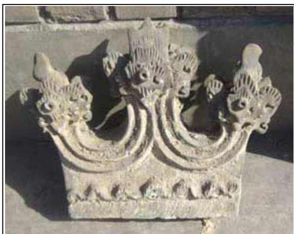
Élément de toiture en terre cuite