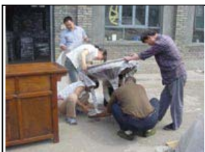
1 – L'effort, le chargement à l'atelier

Découvrez sur le site les 3 étapes cruciales du chargement d'un container « Caractères de Chine » et le travail en cours à l'atelier, à la page des restaurations : Cliquez sur ce lien