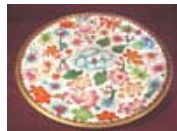
Assiette en cloisonné PA.0504.19