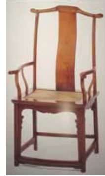
Fauteuil Ming classique avec plateau canné (Collection privée)

Deux nouveaux meubles avec du cannage : TA.0310.07 et TA.031005