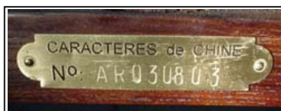
Exemple d'une plaquette

Notre certificat se veut le reflet de notre transparence et notre honnêteté. C'est le meilleur moyen que nous avons trouvé pour vous garantir l'authenticité de nos meubles.