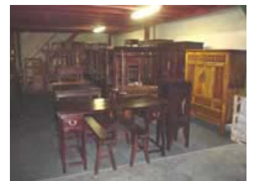
Les meubles après déballage