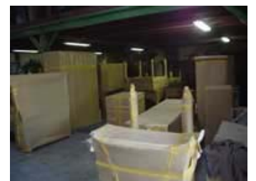
Les meubles dans leur emballage carton à l'arrivée du container

Ou sur le site à la page « CDC en France ».